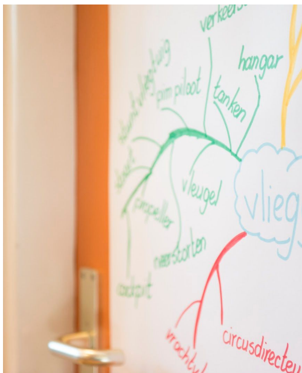
Ondernemend, onderzoekend en zelfstandig